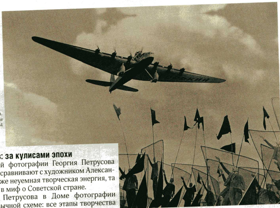
Георгий Петрусов. «Самолет «Максим Горький». 1934