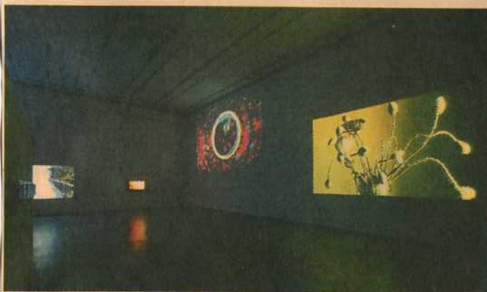
Выставка «Электрические ночи» приехала из Парижа